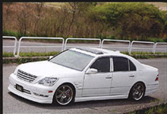
エアロを装着して車室が快適に、その外見もオーナーに喜んでもらえる。乱入のエアロフォルムは、見た目満足感をオーナーに与えてくれる。新車価格にエアロをプラスしてランリユラグジのエアロフォルムは、見た目の満足感をオーナーに与えてくれる。

エアロテックジャパンが乱入しリイズで展開するエアロフォルムは、ブランドによって多少の差はあるものの、エアロを装着したことによるスタイルの変化と、エアロを装着したことによる満足感をオーナーに味わってもらおうというのが基本的なコンセプト。ここで紹介するランドリユラグジは、ハイタイプ「私人スタイル」で見せたデザインを、パンパータイプにモデルアップし、さらに高級感とオリジナリティを打ち出したもの。もっとも特徴的なのはフロントのパンパータイプ。エアロで、乱入の特徴ともいえる前方に張り出すようにデザインされたリップや、フォグランプの小さなダクト、パンパー左右に設定された大きなエアロテクニションモールドが、スポーティ