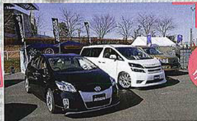
PRIS ダムドクリムソン

リヤビューカメラやミラーモニターなど、機能系アイテムに多くの来場者が注目していた。