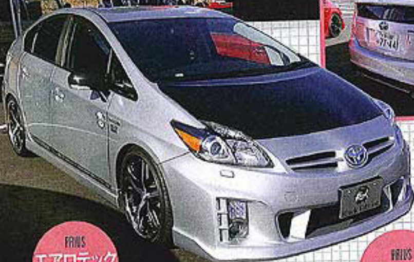
PRIS エアロテック ジャパン

リヤビューカメラやミラーモニターなど、機能系アイテムに多くの来場者が注目していた。