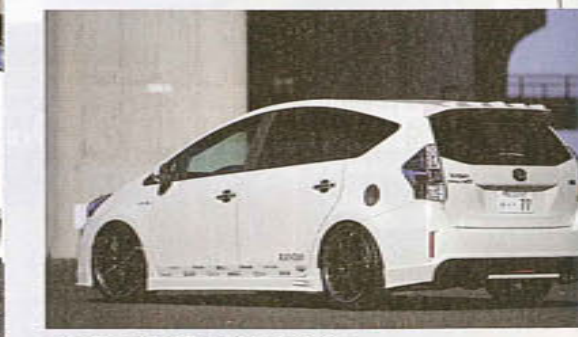
↑大口径のラウトを履いたプリウスα。他のαとは一線を画す堂々とした印象を与える。