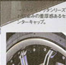
↑マキナイゾッタシリーズは、中央の厚み感あるセンターキャップ。 ↑リムの間に埋め込まれるピアスホルトがオシャレ。