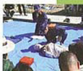
1 いざという時に人命を守るのが緊急救命。A E Dの講習会も行われた。