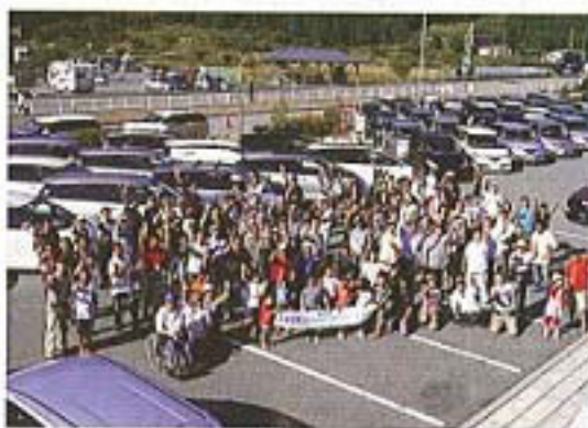
1 エスティマハイブリッド約70台、総勢100名程度が参加した。イベント実行の主催者やコアなファンは、前夜から盛り上げていたようだ。