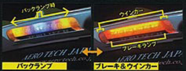
純正ハイマウントをベースに、両端をウインカー、中央をブレーキとし、バック時には中央から両端へと光が流れる加工を施す。

A ドレスアップは年齢に関係なく楽しめる大人の楽しみ。オフ会に行けば仲間も一杯できますのでぜひ参加してください!