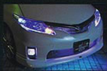
バンパー開口部やライト横に仕込んだLEDは、スイッチで自由自在に点灯色を切り替え可能。